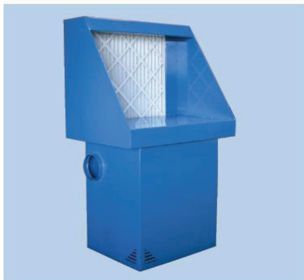
Colour/Farbe: RAL 5007 (structure/Struktur)