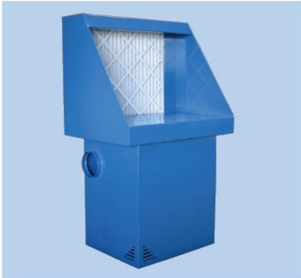
Colour/Farbe: RAL 5007 (structure/Struktur)